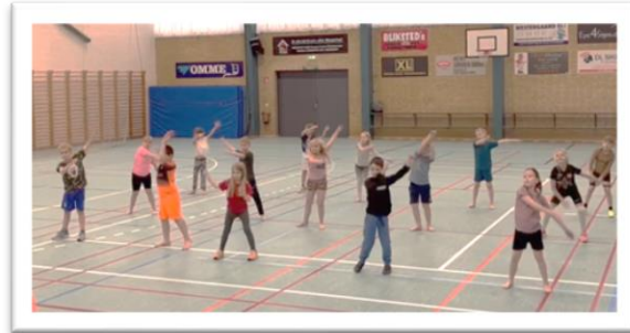
1A øver rytmik og bevægelse

Børnerådet er i gang med at udvikle en ny strategi om fremtidens Børneråd, og i den forbindelse har de spurgt 6. A om, hvad de tænker, der kan være relevant for børn og unge.