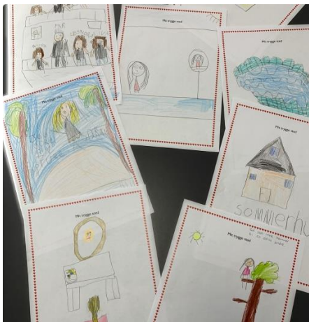
1.a arbejder med tryghed og fællesskaber

Jeg opfordrer derfor til, at børnene først sendes hjemmefra, så det passer med åbningstiden.